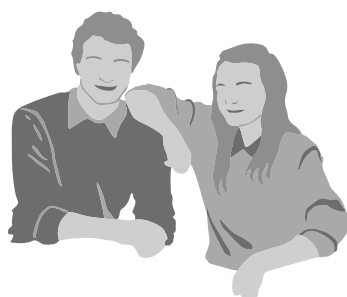
Signalement - Kammeraten

Kammeraten kommer således i første omgang, fordi vedkommende bliver trukket med af en. Hvis man skal fastholde kammeraten, er det vigtigt, at vedkommende får nogle succesoplevelser, som giver lyst til at komme og bakke op om sagen. Det kan fx være oplevelsen af at ens indsats faktisk kan ændre noget og betyder noget. Det handler måske om at vække den unges lyst og gøre aktiviteterne vedkommende.